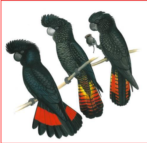
Macho (al lado izquierdo), Hembra (al centro), Juvenil (a la derecha)